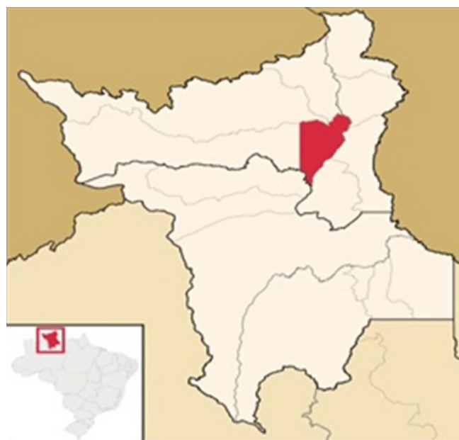
Fig. 1 – Mapa físico del Estado de Roraima, localización en Brasil (recuadro pequeño) y localización del municipio de Boa Vista (en rojo).

Las construcciones humanas se evaluaron esporádicamente en los sitios de muestras descritos en la Tabla 1, con el objetivo de identificar las especies que usualmente no son capturadas en redes de niebla. Para coleccionar los murciélagos en estos locales se utilizaron pinzas de 30 cm o redes de mano unidas aun cable extensible de hasta tres metros de largo.