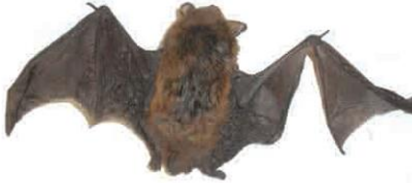
Murciélago con desgarró del patagio del ala.