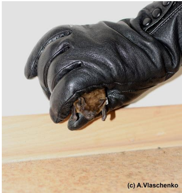
Correcta manipulación del murciélago.