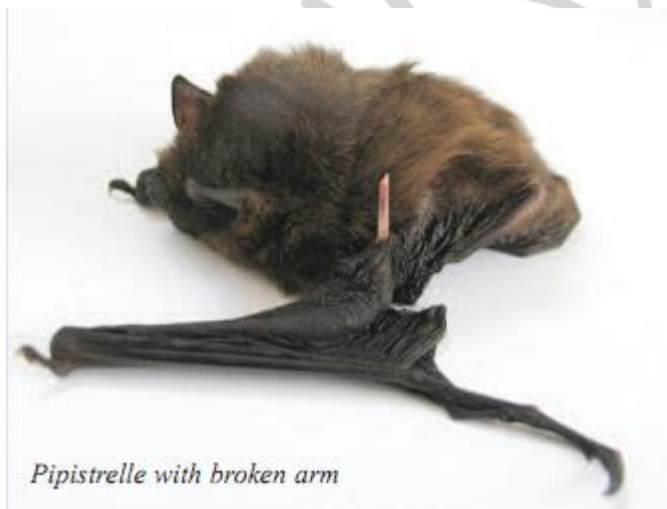
Huesos rotos por colisión o mala manipulación. Imagen de © Gail Armstrong extraída de Bat Care Guidelines de Bat Conservation Trust.

En el caso de ser mordido, por principio de precaución, es imprescindible acudir al médico para valorar la administración de profilaxis post-exposición frente a rabia y conservar el murciélago disponible para ser analizado. Tienes más información disponible de murciélagos y virus en este enlace . También aquí te explicamos porqué son importantes los murciélagos, cuál es su papel que tienen en el ecosistema y porqué conservarlos .