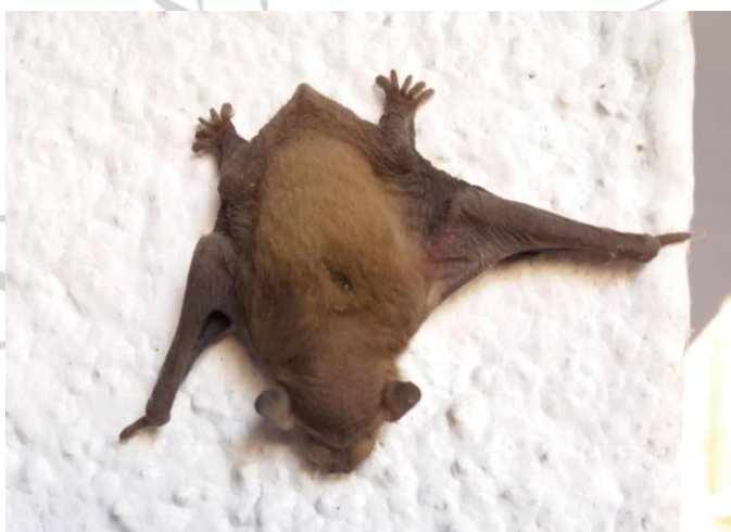
Cría con pelo.