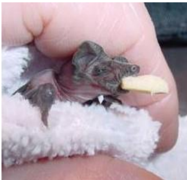
Cría sin pelo.