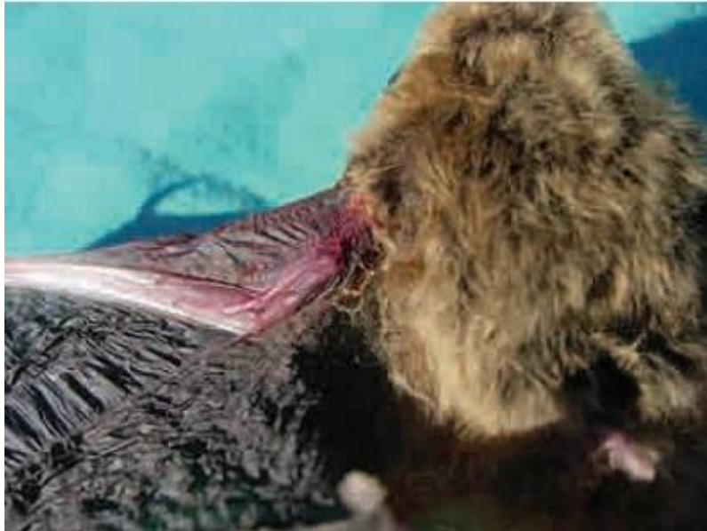
Daño causado por ataque de gato.