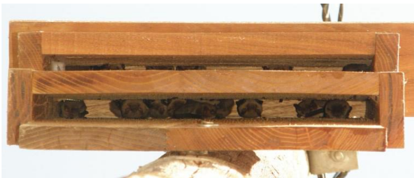
Caja con varios ejemplares ( P. pygmaeus )