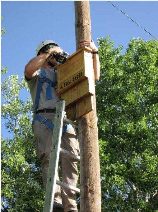
Colocación de la caja