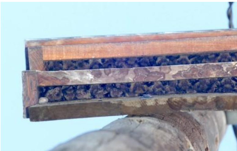
Caja con una colonia de cría ( Pipistrellus pygmaeus )